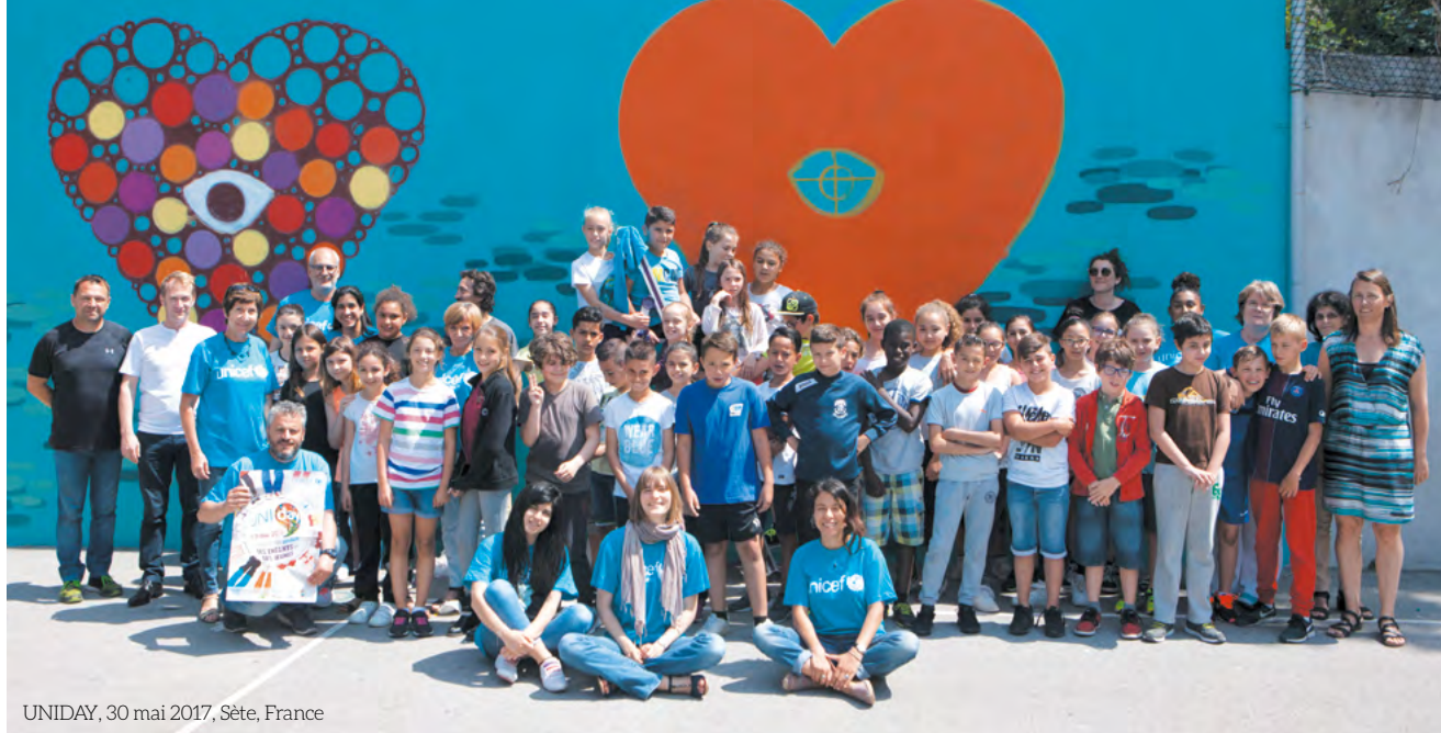
UNIDAY, 30 mai 2017, Sète, France