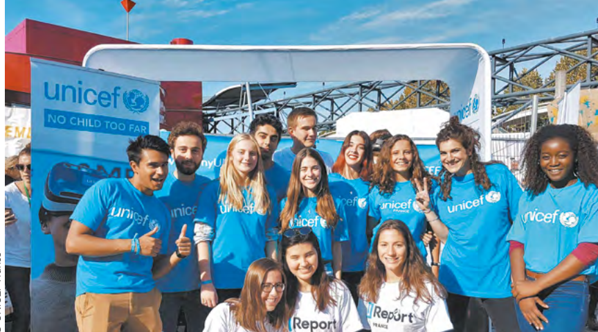
Festival YOUTH WE CAN! Paris, septembre 2017.