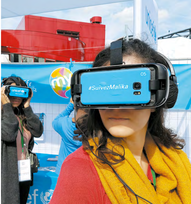
Festival YOUTH WE CAN! Paris, septembre 2017.